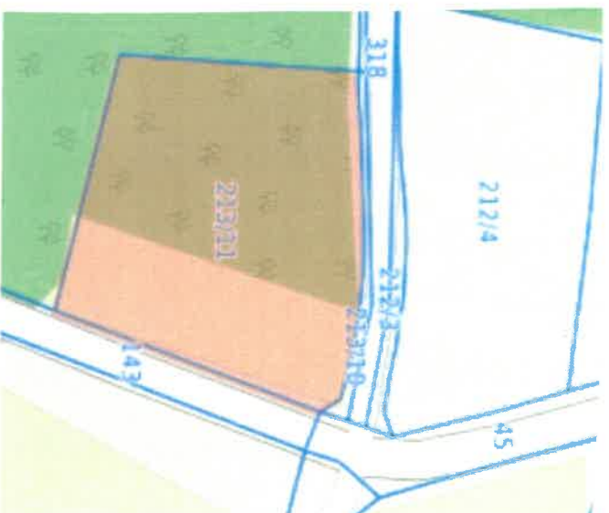
Osiek – cmentarz ewangelicki